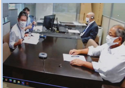
講師陣による講評