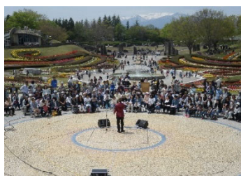
国営みちのく 杜の湖畔公園