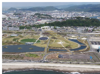
石巻南浜津波復興祈念公園 国営追悼・祈念施設