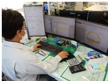
工事発注図面、数量総括表、積算資料、積算データ入力状況