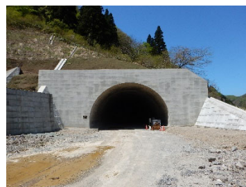
国道47号 高屋道路 猪ノ鼻トンネル(酒田方面)