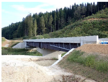
国道47号 新庄古口道路 桁形1号橋(新庄方面)