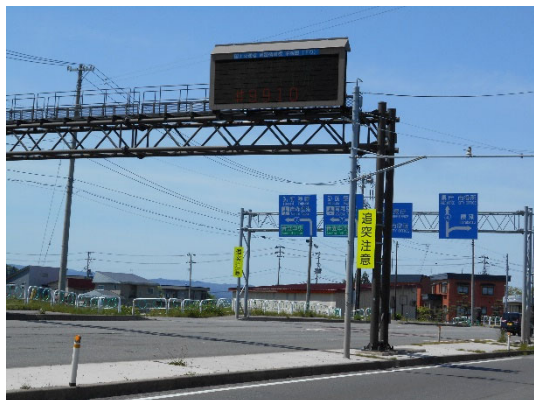
操作した道路情報板： 「道路の異常は緊急ダイヤル#9910へ」